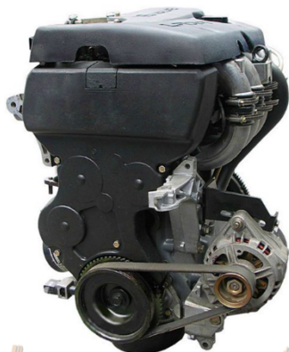
ЗАО «ДиСис» Комплекты разборки и сборки